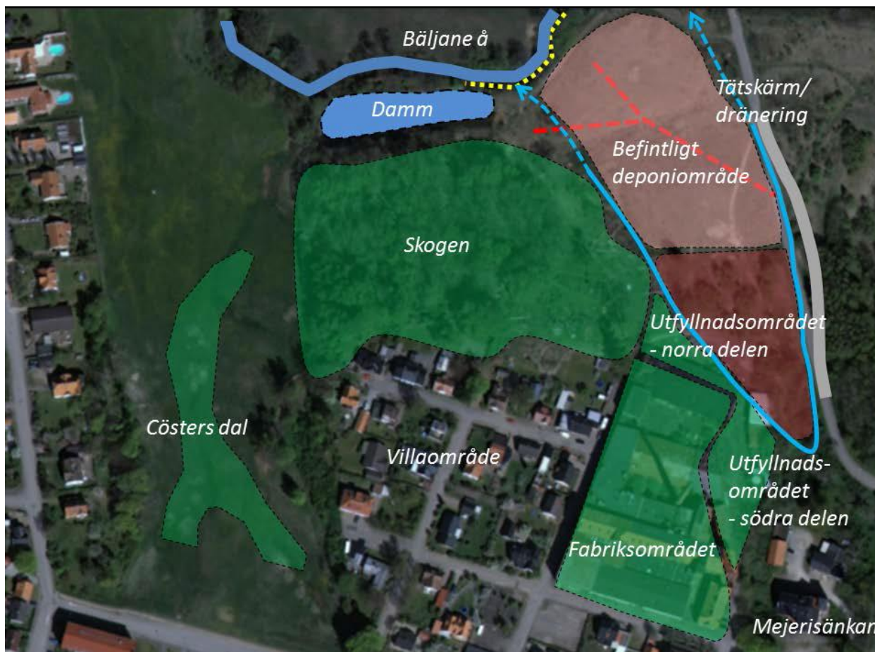
Figur 1. Delområden vid Läderfabriken

I kartan nedan kan ses de olika delområdena som undersökts.