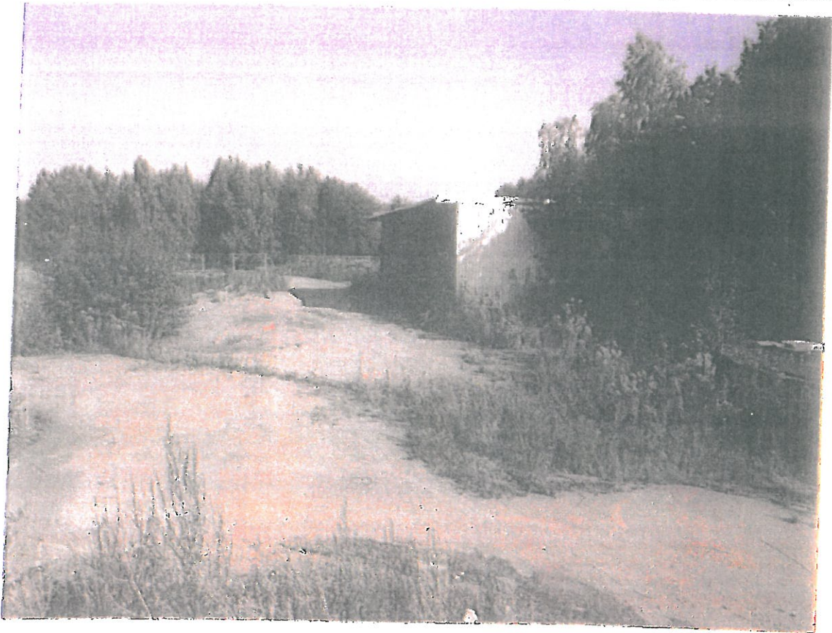
Figur 1. Foto av plåtskjul som ska rivas.