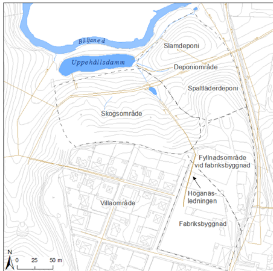
Figur 1. Delområden vid f.d. Klippans läderfabrik

Avfallsmängden i slam- och spaltläderdeponin (se figur 1) har uppskattats till drygt 40 000 m 3 . Mängderna krom och arsenik i avfallet är mycket stora och kan mycket grovt uppskattas till 200 ton krom och 20 ton arsenik. I den ytliga jorden i skogsområdet (se figur 1) förekommer lokalt kraftigt förhöjda halter av både krom (9 500 mg/kg TS) och arsenik (250 mg/kg TS). Korrelationen (samvariationen) mellan de två ämnena är dålig. Mängden arsenik i marken uppgår till knappt 1 ton. I villaområdet (se figur 1) beläget väster och nordväst om fabriksområdet är marken på ca 13 fastigheter också kontaminerad, främst av arsenik (maxhalt ca 330 mg/kg TS).