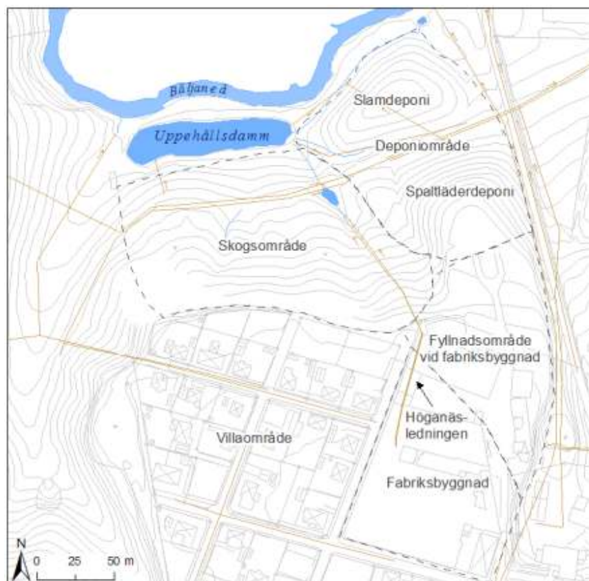
Figur 1. Delområden vid fd Klippans läderfabrik